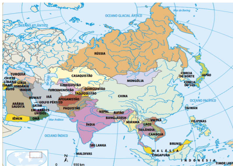
Mapa político da Ásia

O sul e o sudeste da Ásia são áreas muito instáveis do ponto de vista geológico, com áreas sujeitas à erupção vulcânicas e terremotos, que podem provocar grandes tragédias. Um exemplo disso foi o terremoto de 2015 no Nepal, que deixou cerca de 1800 mortos e 5 mil feridos, além de destruir parte da capital do país, Katmandu.