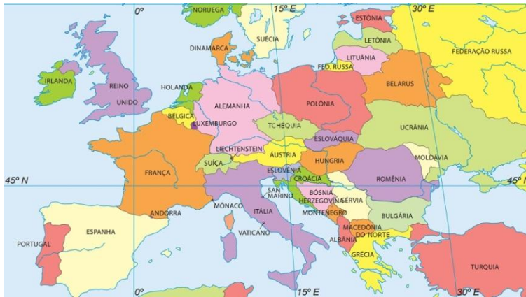
Mapa político da Europa

Rua Marechal Deodoro, 815 – Bairro Centro – Ribeirão Corrente - SP. CEP: 14445-000 - Fone: (16) 3749.1017 Ato de Criação: Lei Municipal Nº 986, de 20 de março de 2008 Email - granduquejose@educacao.sp.gov.br